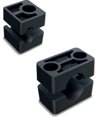
DIN 3015-1 grubu ve DCE-S grubu arasındaki denklik

- DCE-NTG: montaj kılavuzları için somunlar.